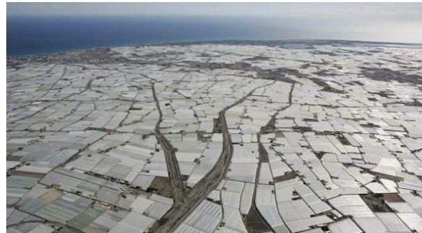
Un mar de plástico