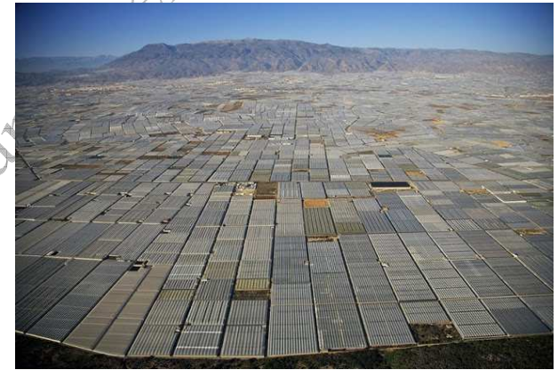
Un mar de plástico