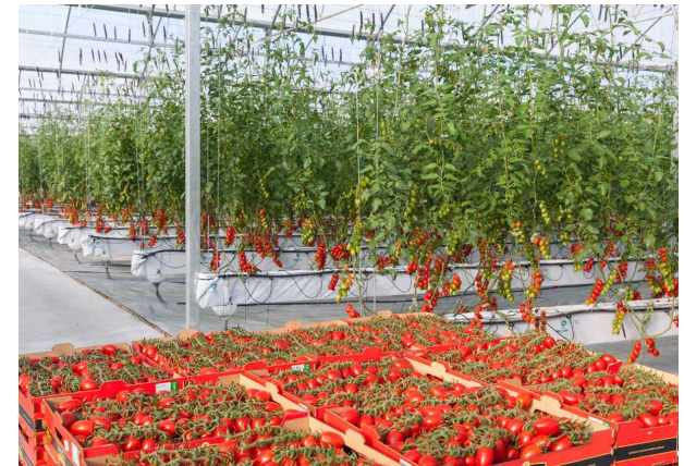
Verduras de aspecto impecable, para la exportación