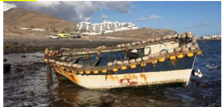
Patera, pequeño barco de pesca en zonas litorales.

En ambos casos, son embarcaciones inadaptadas para navegar en alta mar.