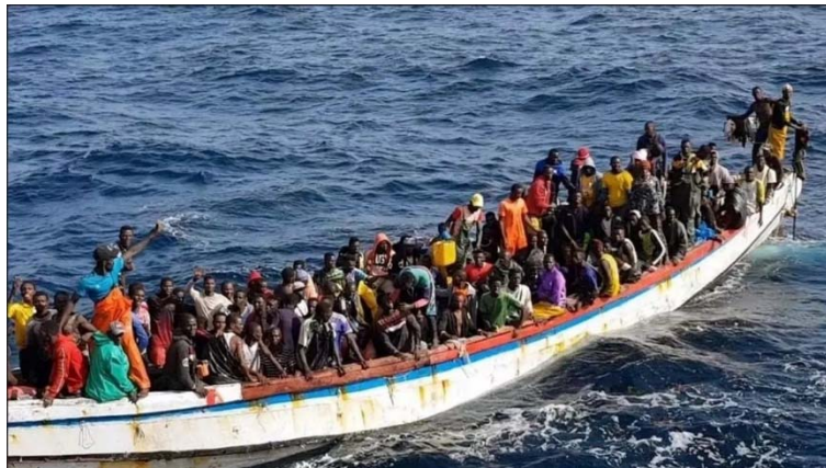
Cayuco, embarcación tradicional, como una piragua.

Voz en off : La ruta canaria es la más mortífera del mundo. Aun así , este año se están batiendo récords con 22 300 (veintidós mil trescientas) llegadas , un aumento del 126%. ( imágenes de una patera que navega con fuerte oleaje y de la llegada a un puerto canario de un cayuco ).