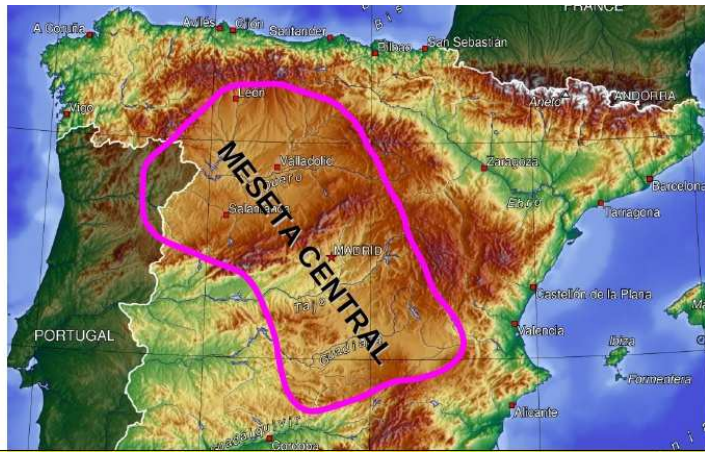
La principal estructura del relieve de la Península Ibérica es la Meseta Central