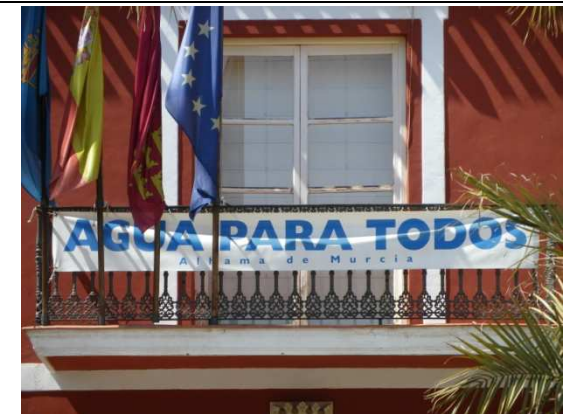
Del Río Tajo al Río Segura