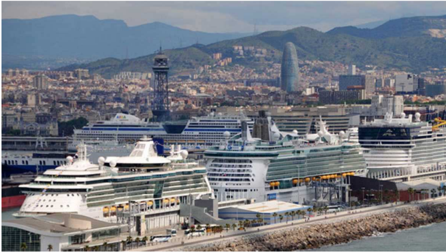
Cruceros en el puerto de Barcelona