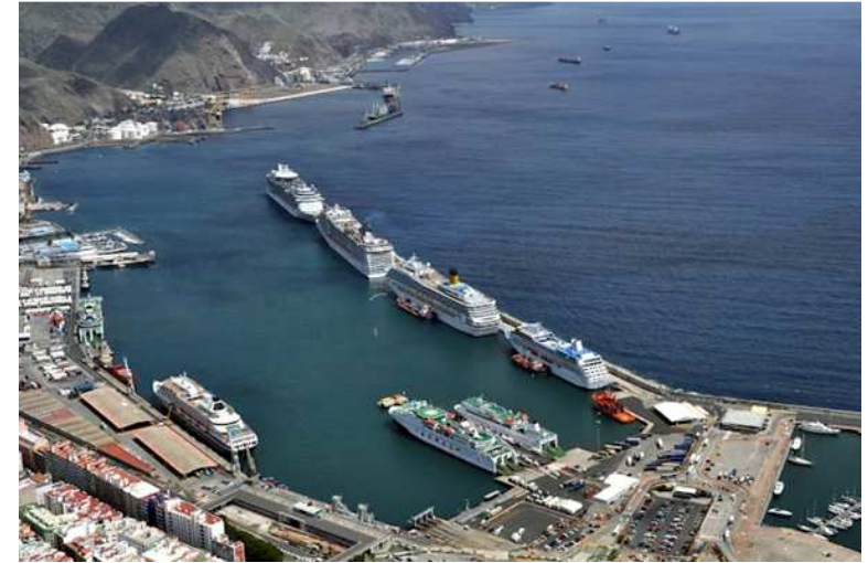
Cruceros en el puerto de Tenerife